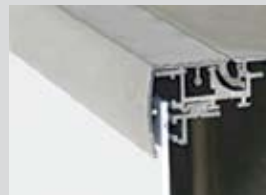
Klapprahmen Wechseltechnik Bautiefe: 55 mm Klappleiste: 35 mm (halbrund) Ausführung: 1-seitig

Hinged alternate frame technology Installation depth: 55 mm Cover strip: 30 mm Design: 1-sided