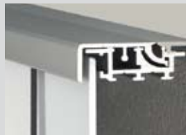
Klapprahmen Wechseltechnik Bautiefe: 55 mm Klappleiste: 30 mm Ausführung: 1-seitig

Hinged alternate frame technology Installation depth: 55 mm Cover strip: 19 mm Design: 1-sided