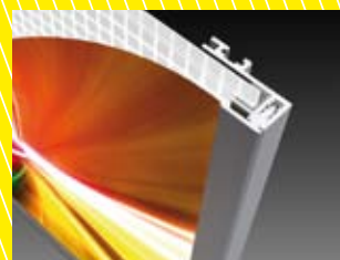
Verglasung mit Steckleiste 19 mm / backloading frame systems (19 mm)