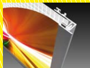
Verglasung mit Steckleiste T-Einbau (25 mm) / backloading frame systems (25 mm)