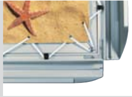
Geöffneter Grafikrahmen „45“ Spanntechnik mit Klapprahmen Wechseltechnik

Open tenter picture frame "45" with hinged alternate frame technology