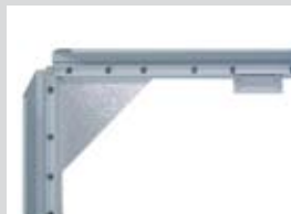
Geöffneter Grafikrahmen „45“ mit Feineinstellungsprofil

Hinged alternate frame technology Installation depth: 45 mm Cover strip: 65 mm Design: 1-sided