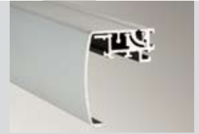
Klapprahmen Wechseltechnik Bautiefe: 45 mm Klappleiste: 65 mm Ausführung: 1-seitig

Hinged alternate frame technology Installation depth: 45 mm Cover strip: 45 mm Design: 1-sided