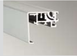
Klapprahmen Wechseltechnik Bautiefe: 45 mm Klappleiste: 45 mm Ausführung: 1-seitig

Open tenter picture frame "45" with hinged alternate frame technology