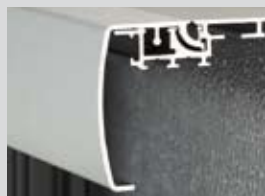
Klapprahmen Wechseltechnik Bautiefe: 55 mm Klappleiste: 65 mm Ausführung: 1-seitig