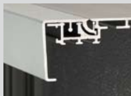
Klapprahmen Wechseltechnik Bautiefe: 55 mm Klappleiste: 45 mm Ausführung: 1-seitig