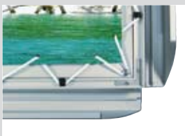
Geöffnete Slim-Lightbox „55“ mit Spanntechnik und Klapprahmen Wechseltechnik