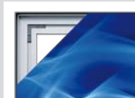
Detailansicht Detail view

SlimFrame "45" profile seemingly frameless design Install. depth: 45 mm Design: 2-sided